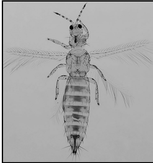
Fig. 1 Aspect general al adultului speciei Frankliniella occidentalis (sursa: www.agric.nsw.gov.au )